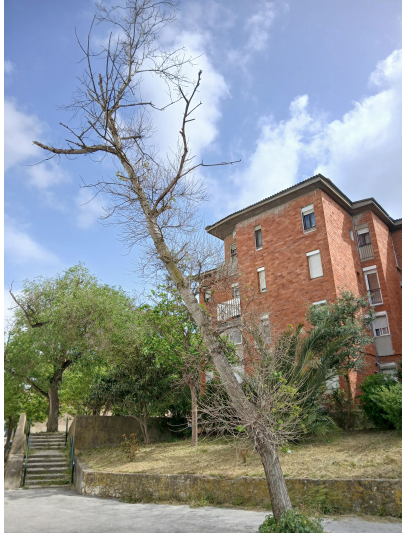
Localização da árvore com cod. SIG 60751: Olivais - Rua Cidade da Beira