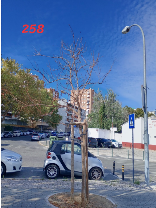
Localização da árvore com cod. SIG 258: Olivais - Rua Almada Negreiros